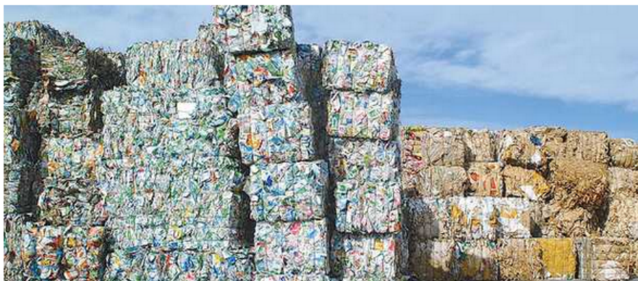
Energía y aluminio de los tetrabricks